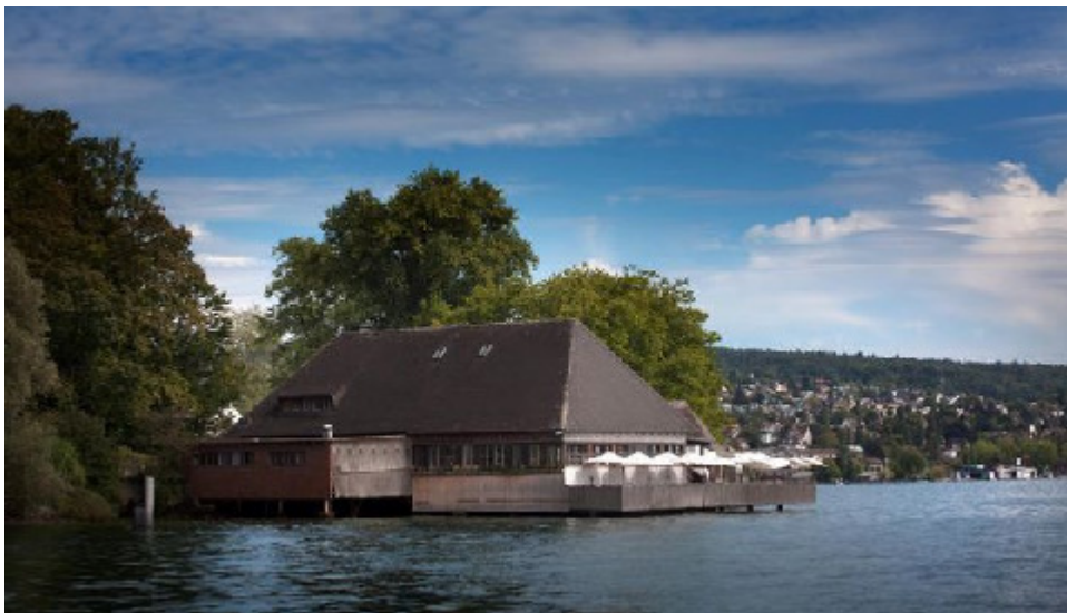
Fischstube (gen. Fischerstube) Zürichhorn, 8008 Zürich