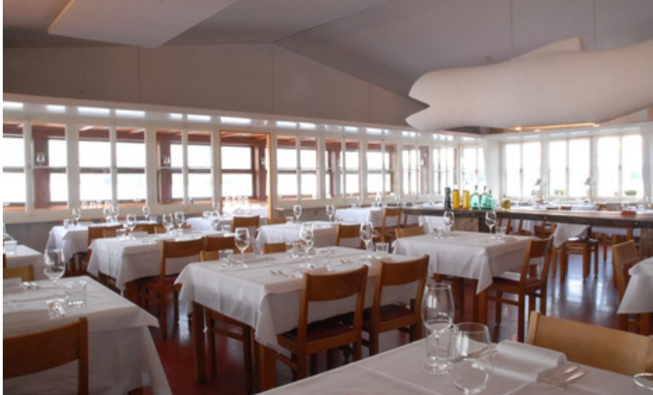
Rest. Fischstube nach der Renovation i.J. 2012