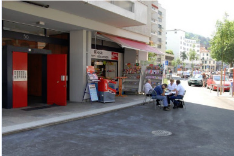
Lämmli Brunnenstr. 50, 9000 St. Gallen