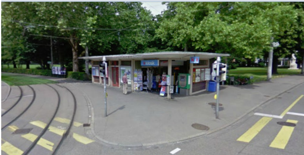
Kreuzung Spalenring, Steinenring, Bundesstrasse, 4051 Basel