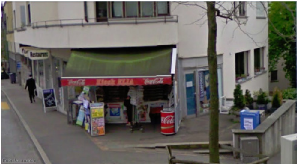
Haldenbachstr. 10, 8006 Zürich