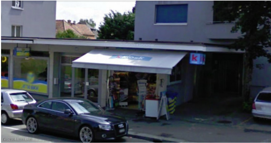
Albisriederstr. 369, 8047 Zürich